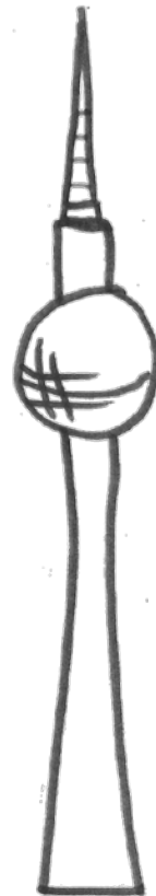
Berlin ist der Fokus der Studie

2016 waren es mit unter 15.000 Flüchtlingen dann deutlich weniger (Landesweiter Koordinierungsstab Flüchtlingsmanagement, Stand: 10.5.2016).