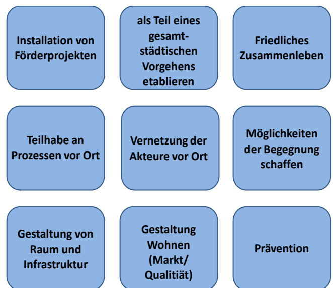
Abbildung 1: Zentrale Maßnahmen aus dem Handlungsfeld Sozialraum

schon daran ablesen, dass die Konzepte in den meisten Fällen ein eigenes Handlungsfeld zum Thema enthalten. Für Kommunen mit reflexivem Diversitätskonzept ist die Bedeutung der Sozialraum-Perspektive nicht automatisch besonders hoch, allerdings verfolgen alle Konzepte, in denen der Sozialraum eine Sonderstellung einnimmt, zumindest einen solchen Ansatz. Inhaltlich haben sich neun zentrale Aspekte herauskristallisiert, die von besonderer Bedeutung sind (siehe Abbildung 1). Sie beziehen sich teils auf ein strategisches Vorgehen, auf den konkreten Raum oder auf soziale Prozesse.