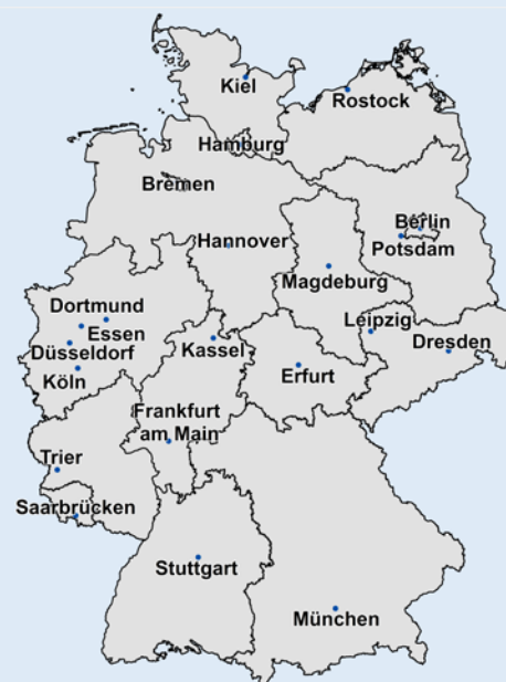
Untersuchte kommunale Integrationskonzepte

Leitlinien-Katalog hinausgehen. Die Methode der Dokumentenanalyse stellt die Integrationskonzepte in den Mittelpunkt, lässt dabei aber keine Aussage über die Wirkung in der Praxis vor Ort zu.